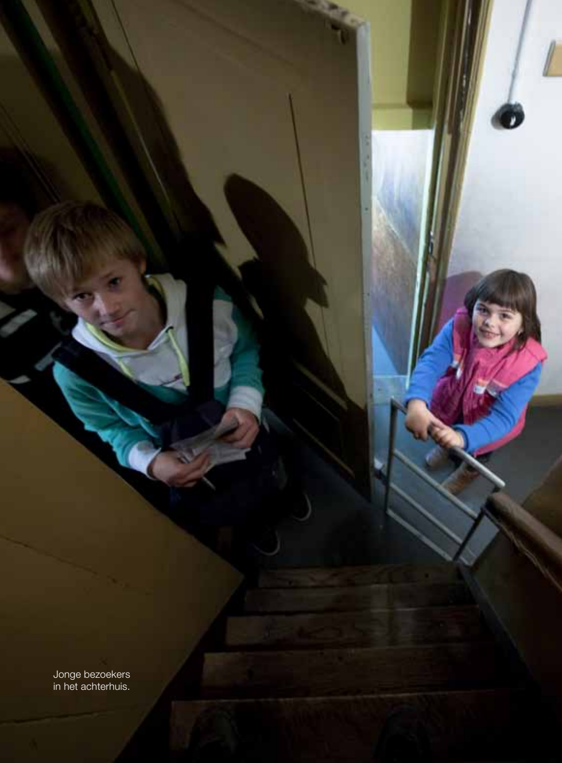
Jonge bezoekers in het achterhuis.

In Nederland wordt de Anne Frank Stichting (AFS) ondersteund door twee onafhankelijke stichtingen, te weten de Stichting Vastgoed AFS (beheer en onderhoud van de gebouwen die bij de AFS in gebruik zijn) en de Stichting Vrienden van de AFS, financiële ondersteuning bij (tijdelijk) teruglopende inkomsten.