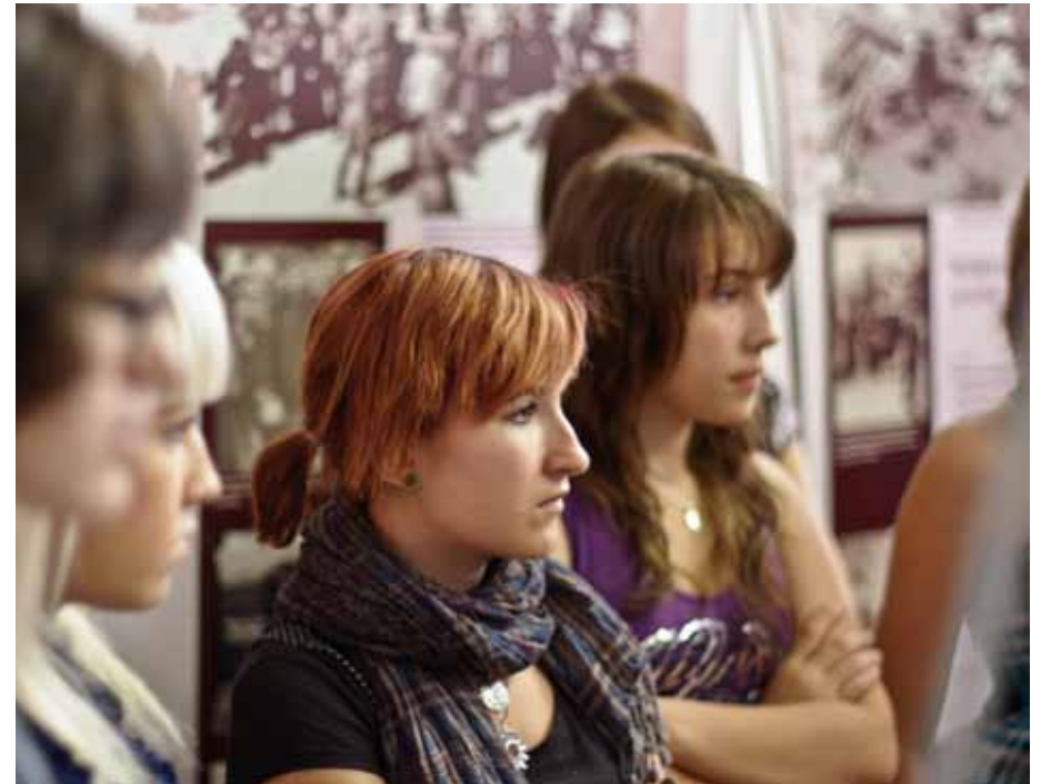
Jongeren bij de Anne Frank-tentoonstelling in Rusland.