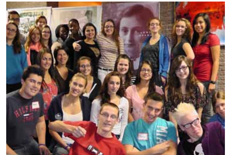
Leerlingen uit Québec, volgen een gidsentraining om medeleerlingen rond te leiden.