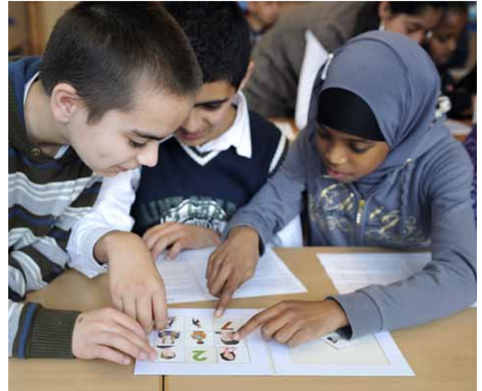
Groep 8 van basisschool de Piramide in Haarlem aan het werk met de Anne Frank Krant.