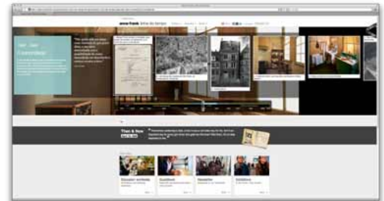
De Anne Frank Tijdlijn in het Portugees.