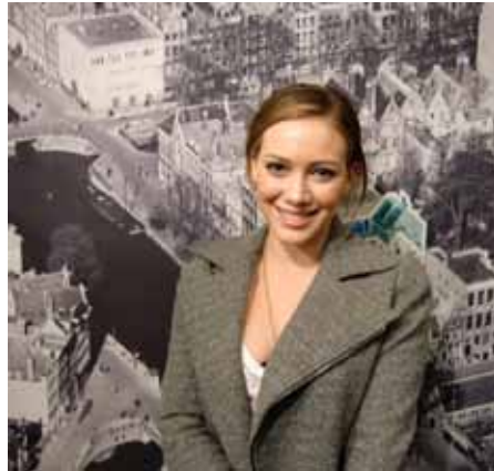
Actrice en zangeres Hilary Duff bezoekt het museum, na afloop twittert ze: '... So sad, but fascinating, couldn't imagine how scary that would be.'