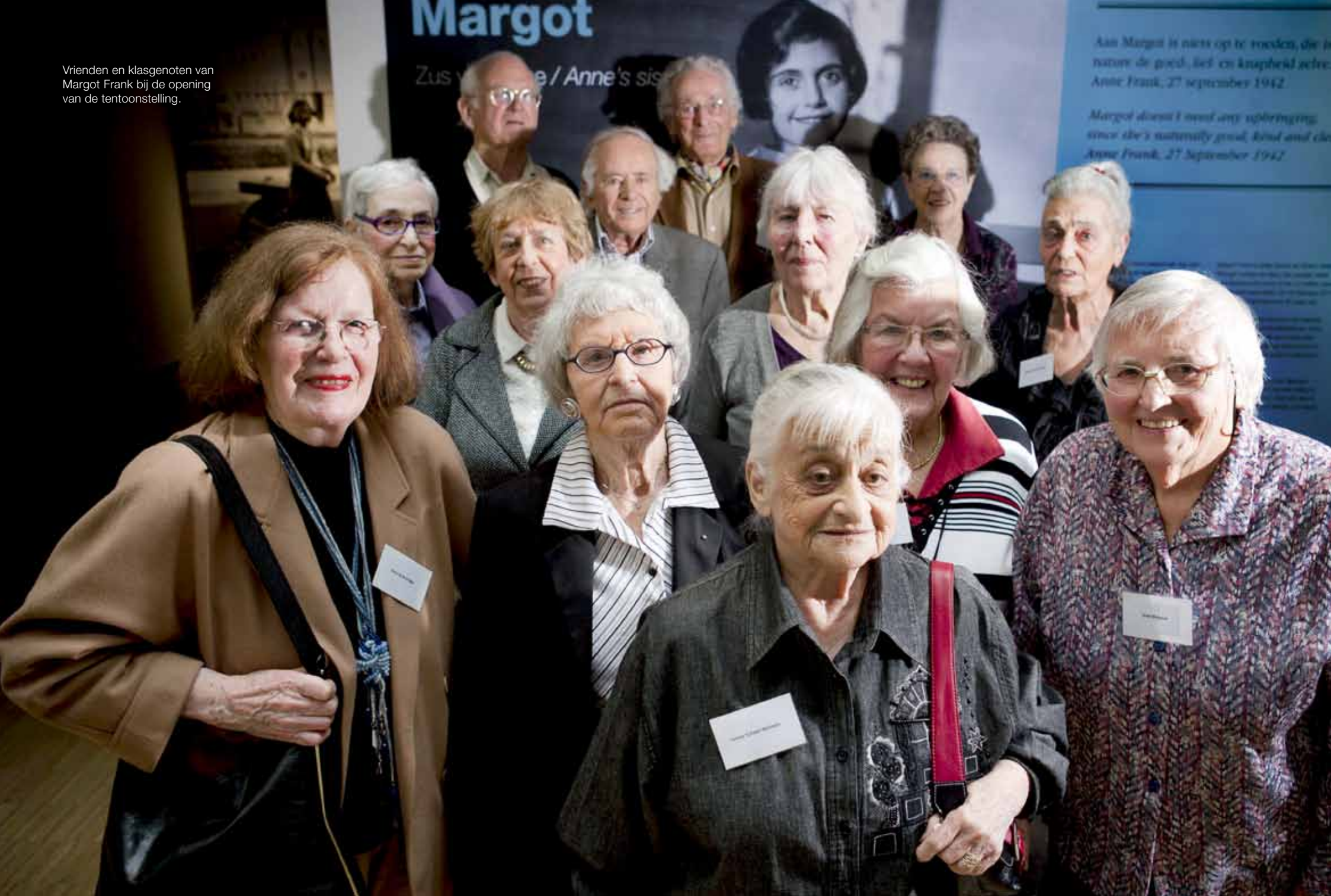
Vrienden en klasgenoten van Margot Frank bij de opening van de tentoonstelling.