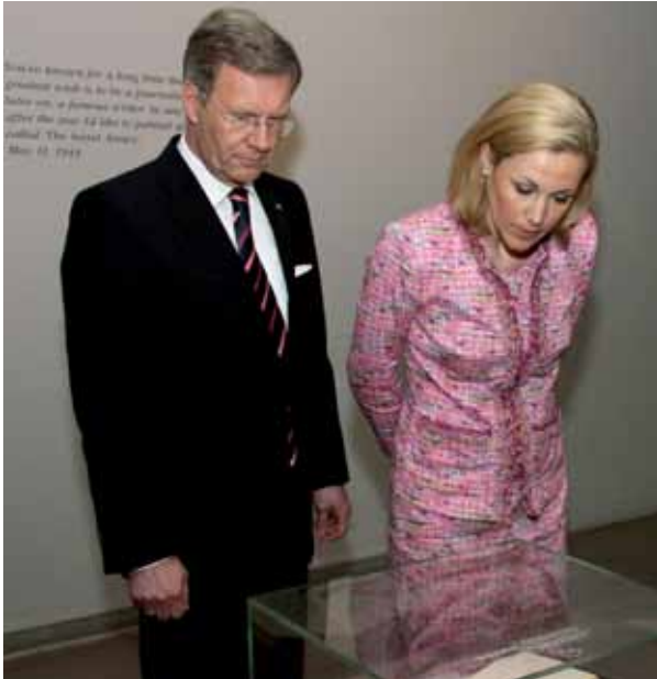
De Duitse bondspresident Christian Wulff en zijn echtgenote Bettina bij het dagboek van Anne Frank.