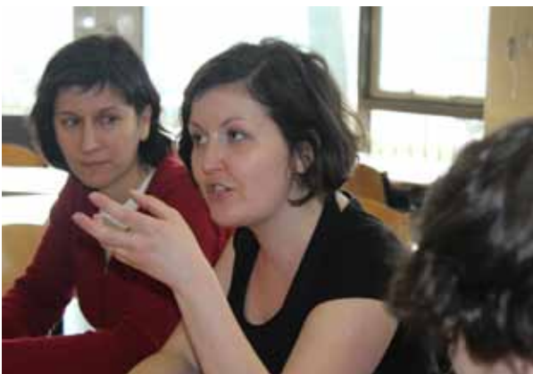
Poolse docenten tijdens het bezoek in Nederland.