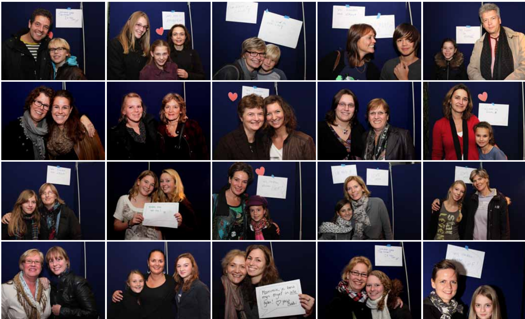
'Moeders en dochters' samen op de foto tijdens de museumnacht.